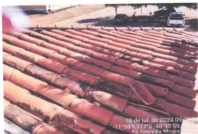
3. TELHADO COM AS TELHAS QUEBRADAS