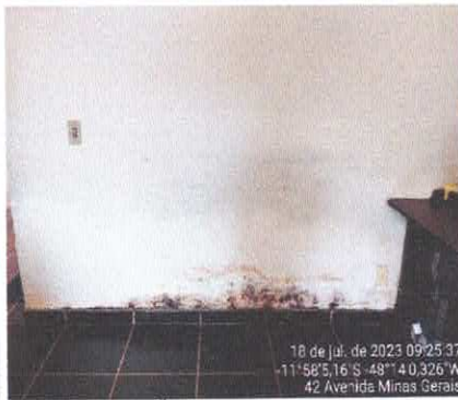
5. INFILTRAÇÃO DE PAREDE