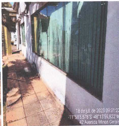
12. PINTURA PAREDE COM DESGASTE