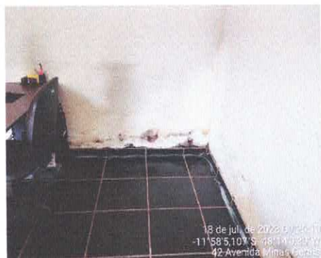
4. INFILTRAÇÃO DE PAREDE

O Paço Municipal tem vários problemas devido à falta de manutenção dos telhados e vazamentos hidráulicos. Devido esses fatores apareceu várias as Infiltração.