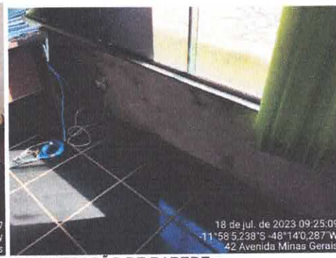
6. INFILTRAÇÃO DE PAREDE