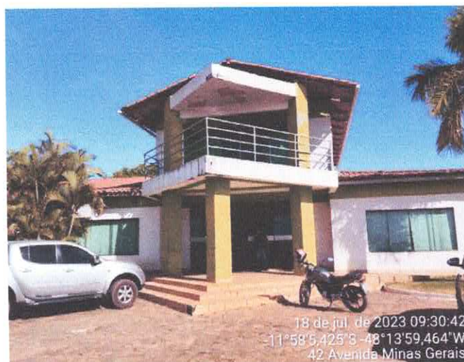
1. INFILTRAÇÃO DEVIDO AS COTEIRAS DO TELHADO

As cumeeiras danificadas e com fissuras também deverão ser substituídas.