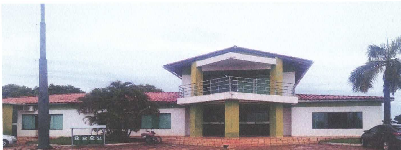
10. PINTURA DE PAREDE COM DESGASTE NATURAL PELO TEMPO DE USO