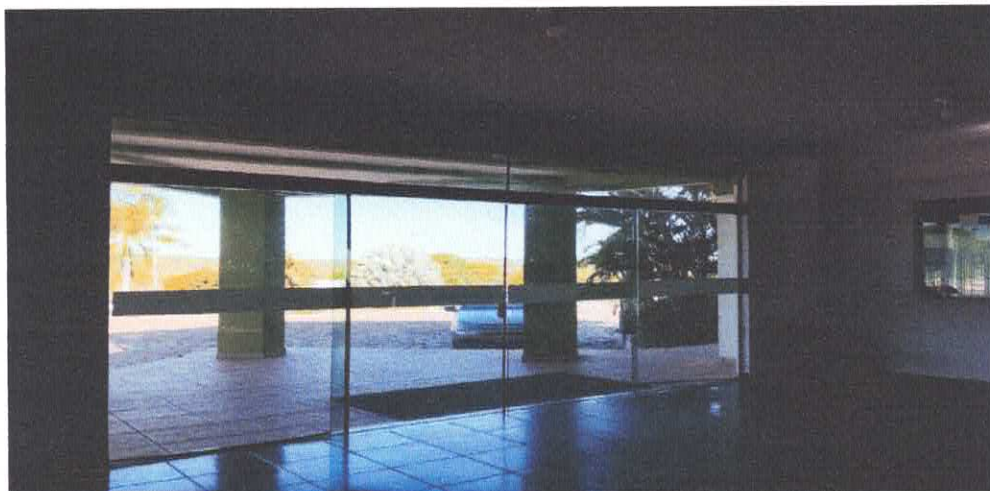
14. PORTA DE ENTRADA DO PAÇO MUNICIPAL