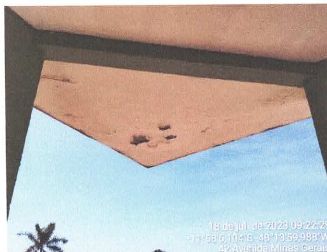
2. INFILTRAÇÃO DEVIDO AS COTEIRAS DO TELHADO