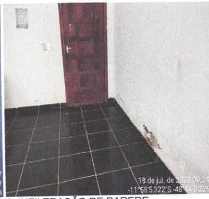
8. INFILTRAÇÃO DE PAREDE