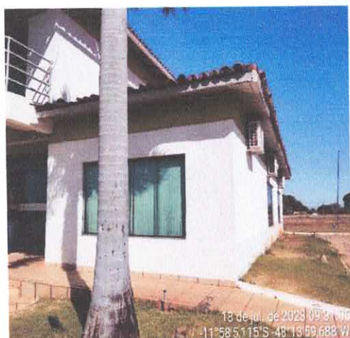
11. PINTURA PAREDE COM DESGASTE