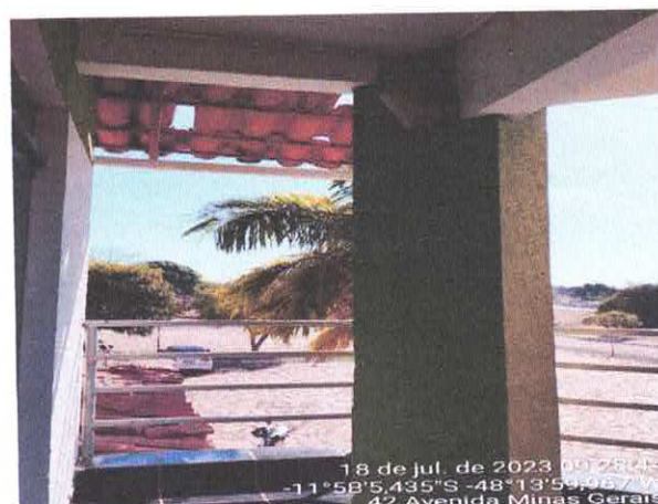
4. TELHADO COM AS TELHAS QUEBRADAS