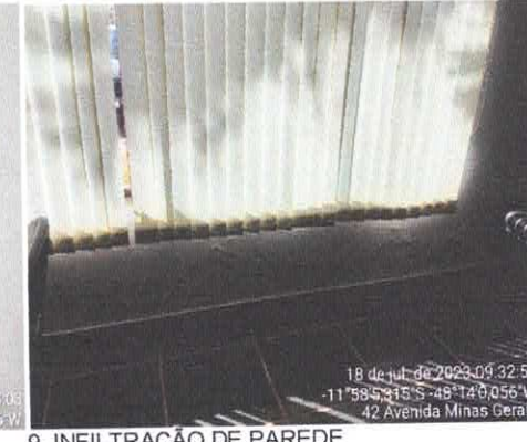
9. INFILTRAÇÃO DE PAREDE