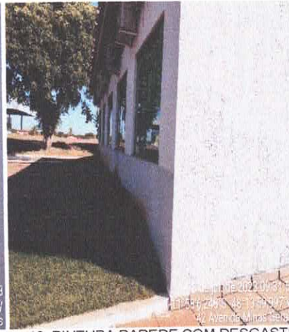
13. PINTURA PAREDE COM DESGASTE